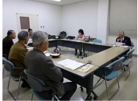
史跡本の内容検討委員会