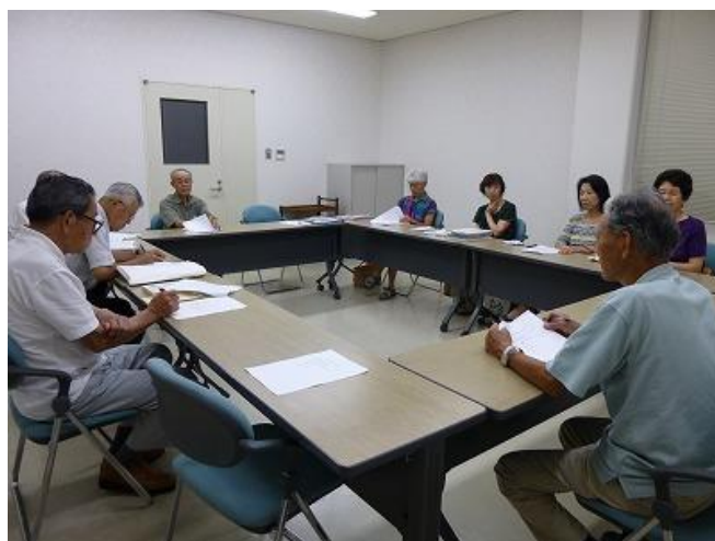
第1回東出雲の再発見実行委員会