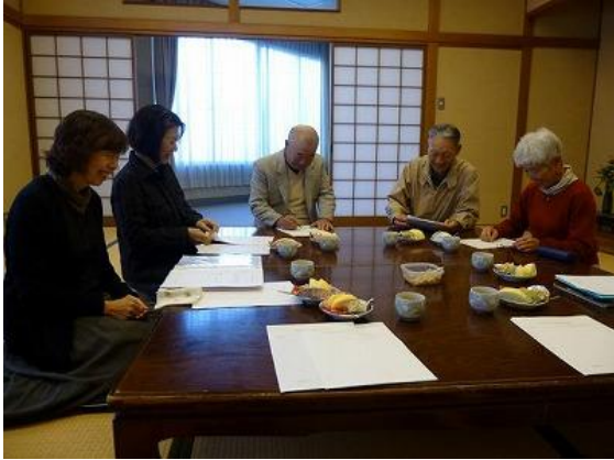
紙芝居作成委員会